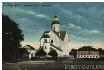
Новгород. Церковь Спаса на Нередице.

У. «Образ Садко, бедного народного гусяра, который одерживает победу и над купцами и над соблазнами сказочного подводного царства, который спасается потому, что для него нет ничего более высокого и святого, чем родной русский Новгород, – этот образ, глубоко национальный и исторический, действительно принадлежит к самым ярким созданиям русской народной поэзии» (В.Я.Пропп).