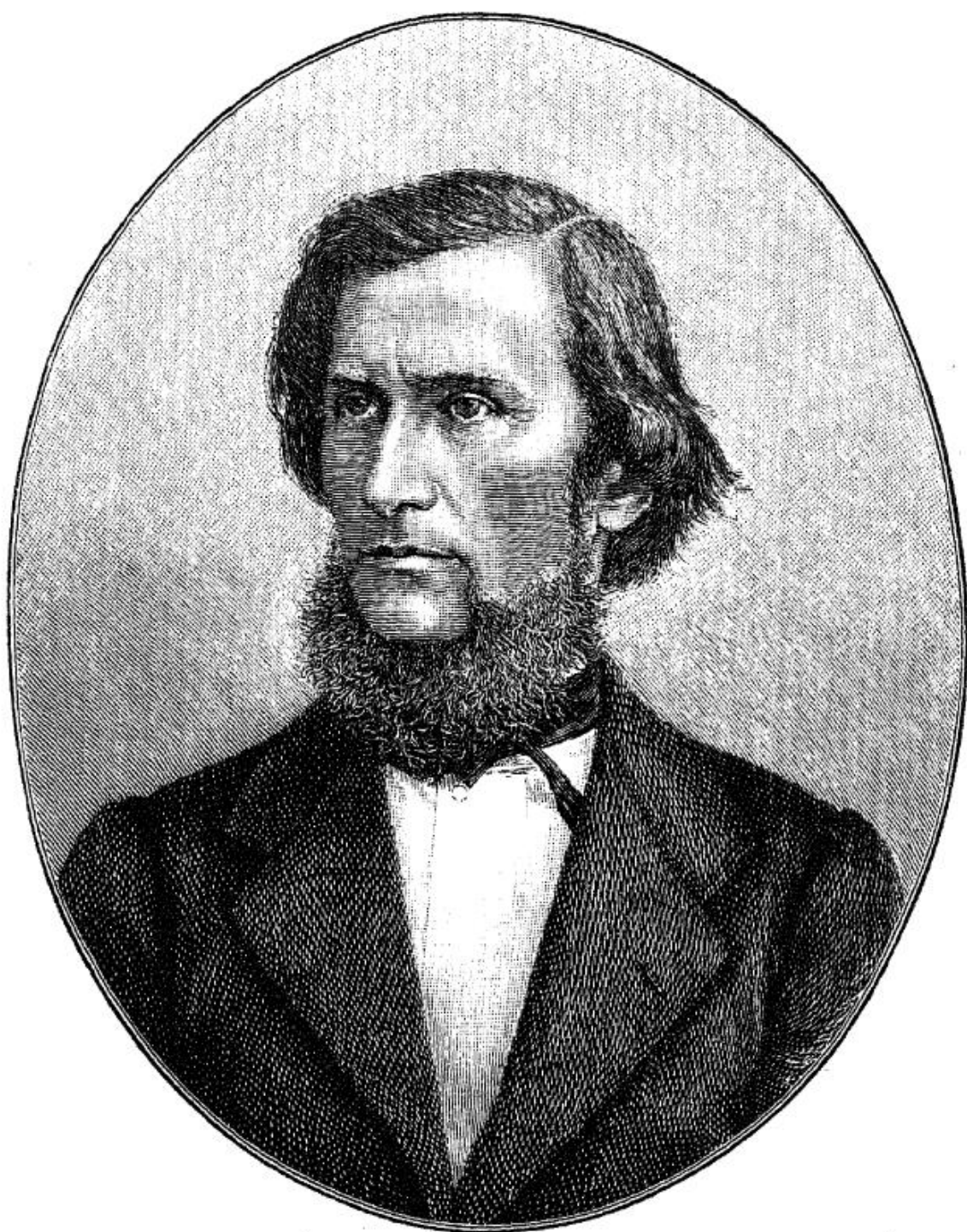
К. Д. УШИНСКІЙ.