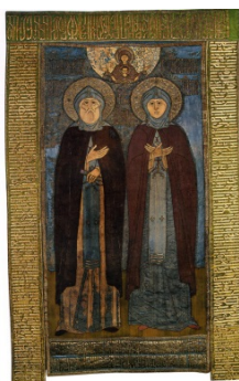
Покров с изображением Петра и Февронии – вклад в Богородице-Рождественский собор царя Федора и царицы Ирины

У. Сравните это житие с «Повестью о житии Петра и Февронии...», написанной Ермолаем-Еразмом столетием раньше.