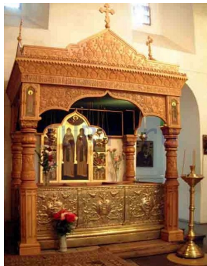
Муром, Троицкий женский монастырь. Рака с мощами благоверных Петра и Февронии

У. Чем традиционно, подобно житию, начинается жизнеописание, написанное Ермолаем-Еразмом?