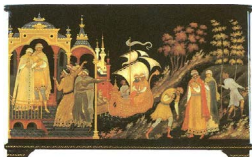
В.М. Ходов. Петр и Феврония. Ларец. Палех

У. - Состарившись, супруги приняли постриг. Постриг в конце жизненного пути был