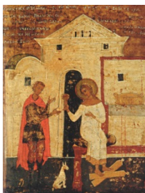
Клеймо иконы с житием святых Давида и Ефросинии