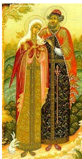
Заяц святой Февронии

У. - Образ Февронии, отраженный в повести Ермолая-Еразма, всегда вызывал двойственное отношение к себе. С одной стороны, она выступает как христианская святая, с другой – как сказочная чудесница.