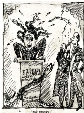
Неизв. художник. Злой демон С... Карикатура

- Этим высказываниям вторит фельетон «Большой выход у Сатаны», которым Сенковский зарекомендовал себя в качестве «журнального беса». «Если Бог создал человека для того, чтобы его деяния и мысли всегда были пропитаны желчью, и каждая содеянная им пакость приносила бы ему радость – то вот вам портрет Сенковского» (Из отзывов коллег по Университету).