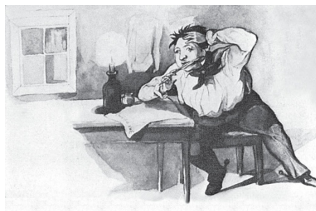
Неизв. художник. Карикатура на Ф.В. Булгарина

Д. Именно Иван Иванович поссорился с Иваном Никифоровичем, а не взаимно они начали противостояние.