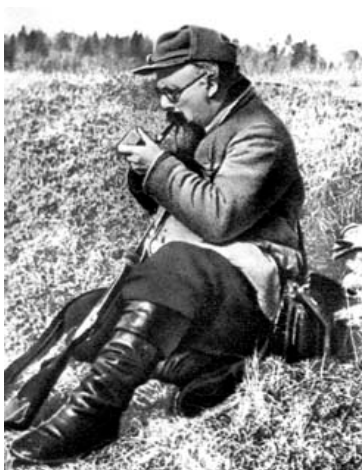
М.М.Пришвин на охоте

У. М.М.Пришвин был путешественником, много ездил и ходил по стране, увлекался охотой, занимался собирательством фольклора. Все это заложило основы для правдивого отражения жизни в его произведениях. Сын писателя вспоминал: «После охотничьего броска по торфяным болотам, немного передохнув, он энергично забрасывает ногу на ногу, вынимает из бокового кармана записную книжку, кладет её на коленку, берет карандаш и начинает что-то записывать, изредка прерывая запись, смотрит в бездонное небо, шевелит губами и опять спешно что-то записывает».