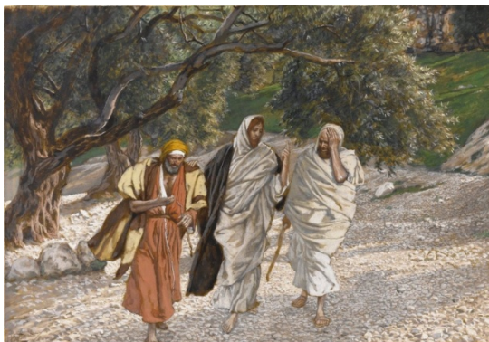
Д. Тиссо. По дороге в Эммаус. 1886 г.

У. - Вероятно, М.Горький, начавший писать роман, будучи в Америке, имел в виду картину американского художника Джеймса Тиссо – автора масштабной серии работ, иллюстрирующих Священное Писание.