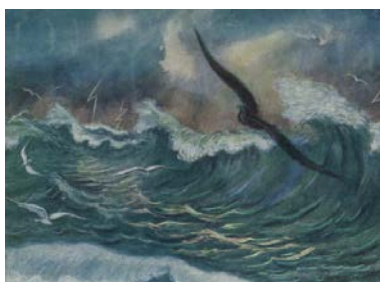
А.П. Могилевский. Буревестник

Поистине, как буря, грядет мое счастье и моя свобода! Но мои враги должны думать, что злой дух неистовствует над их головами.