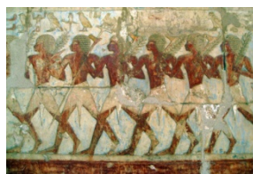
Египетские солдаты из экспедиции в Пунт.