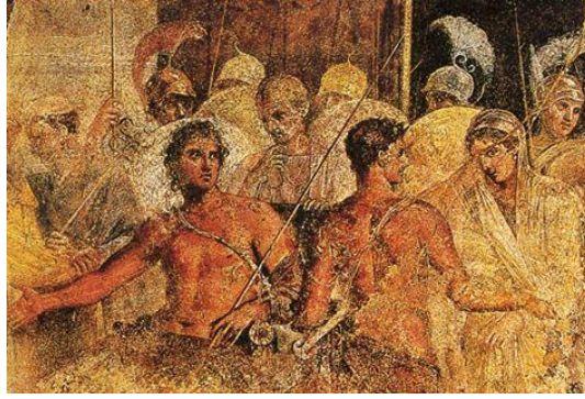
Брисейду уводят от Ахилла. Фреска из дома Трагического поэта в Помпеях. I в.