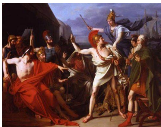
Г. Донателли. Гнев Ахилла