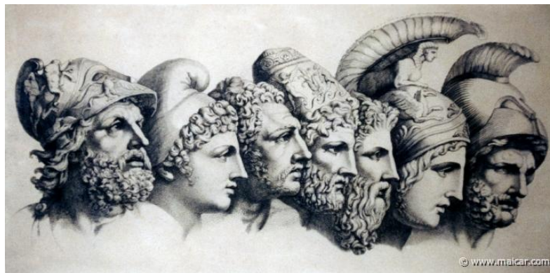
Древнегреческие герои. Крайние справа Ахилл и Агамемнон

Д. По отношению к «пастырю народов Атриду» – Агамемнону.