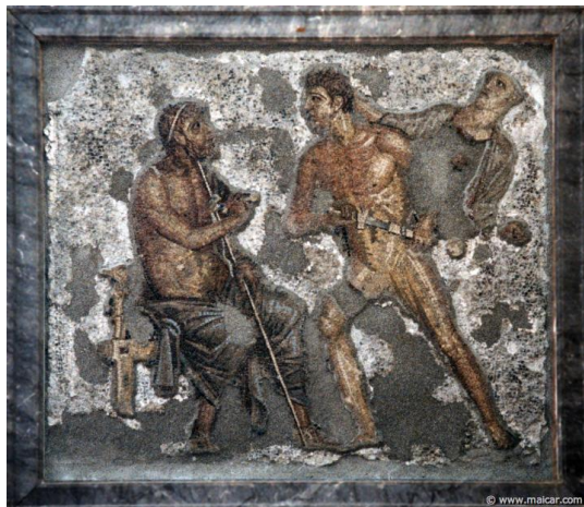
Гнев Ахилла. Мозаика. Помпеи

У. Оба героя объясняют свое поведение вмешательством богов, но Агамемнон – для того, чтобы оправдать себя и обвинить богов, а Ахиллес – чтобы назвать вину человека и привлечь на виновного кару.