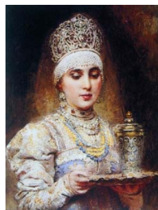
К.Е. Маковский. Поцелуйная чаша

У. В какой последовательности изображено пробуждение царства?