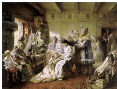
К.Е. Маковский. Под венец